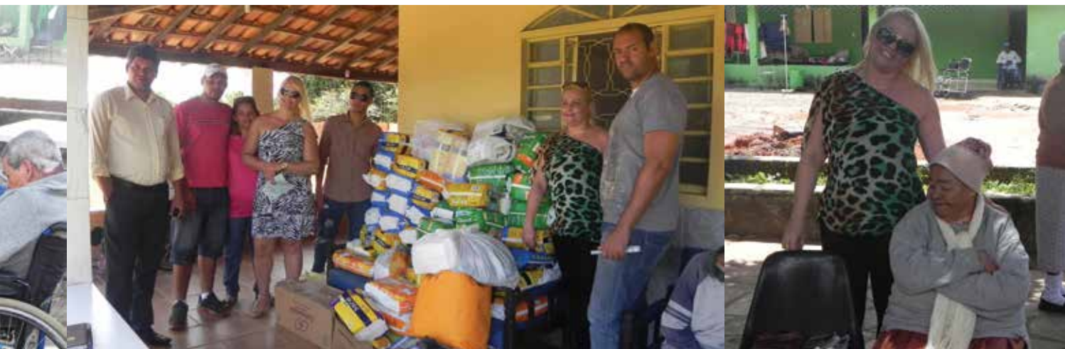
Equipe do Sintramacon-DF arrecadou alimentos e produtos de higiene pessoal para doar à Casa de Repouso Bom Samaritano