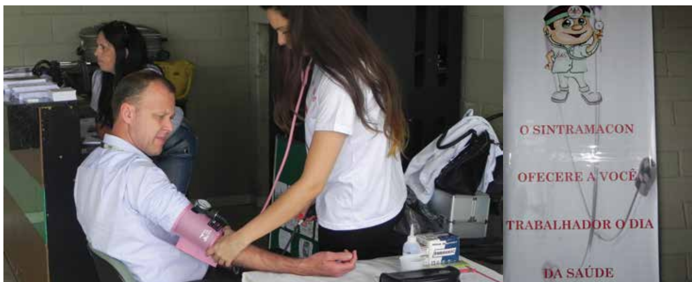
Equipe de atendimento mediu pressão arterial dos trabalhadores e, nos casos necessários, recomendou consulta ao médico. Prevenção é a melhor estratégia quando o assunto é saúde