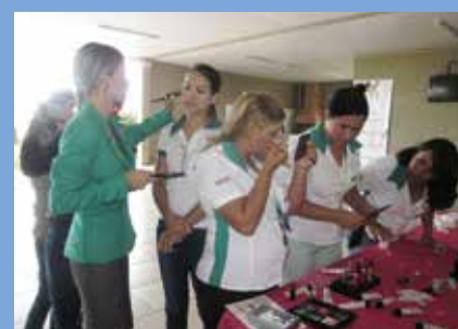
A beleza e os cuidados com a pele também tiveram espaço na ação do sindicato