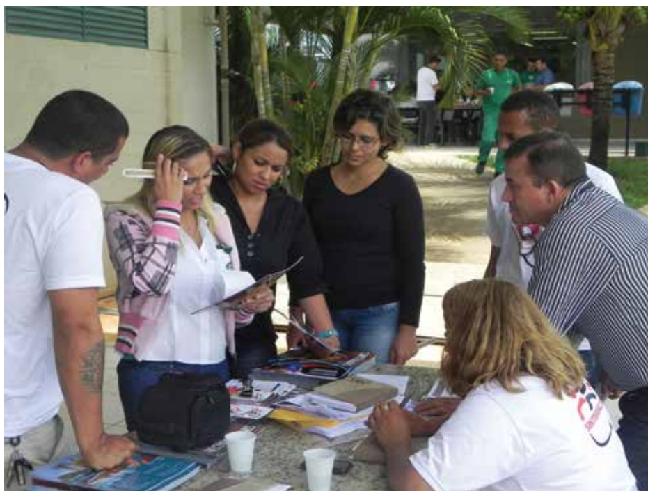
Equipe de base do Sintramacon-DF explica aos trabalhadores as vantagens de ser filiado: atendimento médico e odontológico é uma delas

participação do Sintramacon na empresa, para que os trabalhadores tenham cuidado com a alimentação e a sua saúde. Uma coisa é nós da empresa orientarmos, outra coisa bem diferente é o sindicato vir, ouvir e orientá-los, os colaboradores se sentem valorizados."