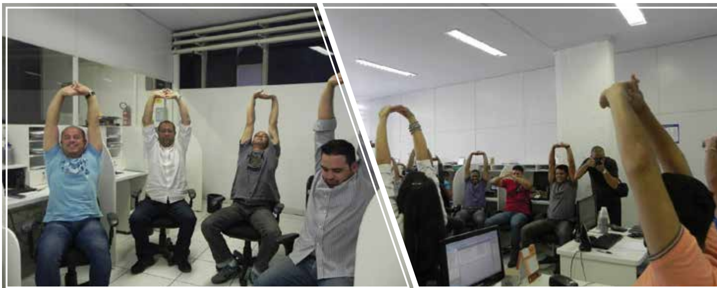
A ginástica laboral é um dos procedimentos mais indicados no ambiente de trabalho porque reduz a incidência de doenças ocupacionais e lesões desta forma diminui os números de afastamentos nas empresas

recuperação de queixas ou desconfortos físicos,” declarou.