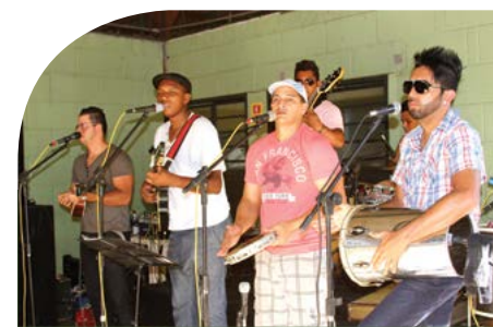
música de qualidade