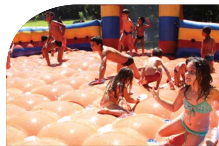
diversão para crianças