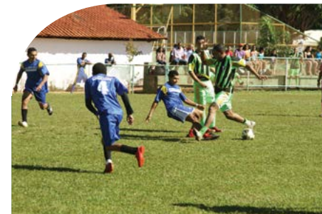
futebol para os trabalhadores