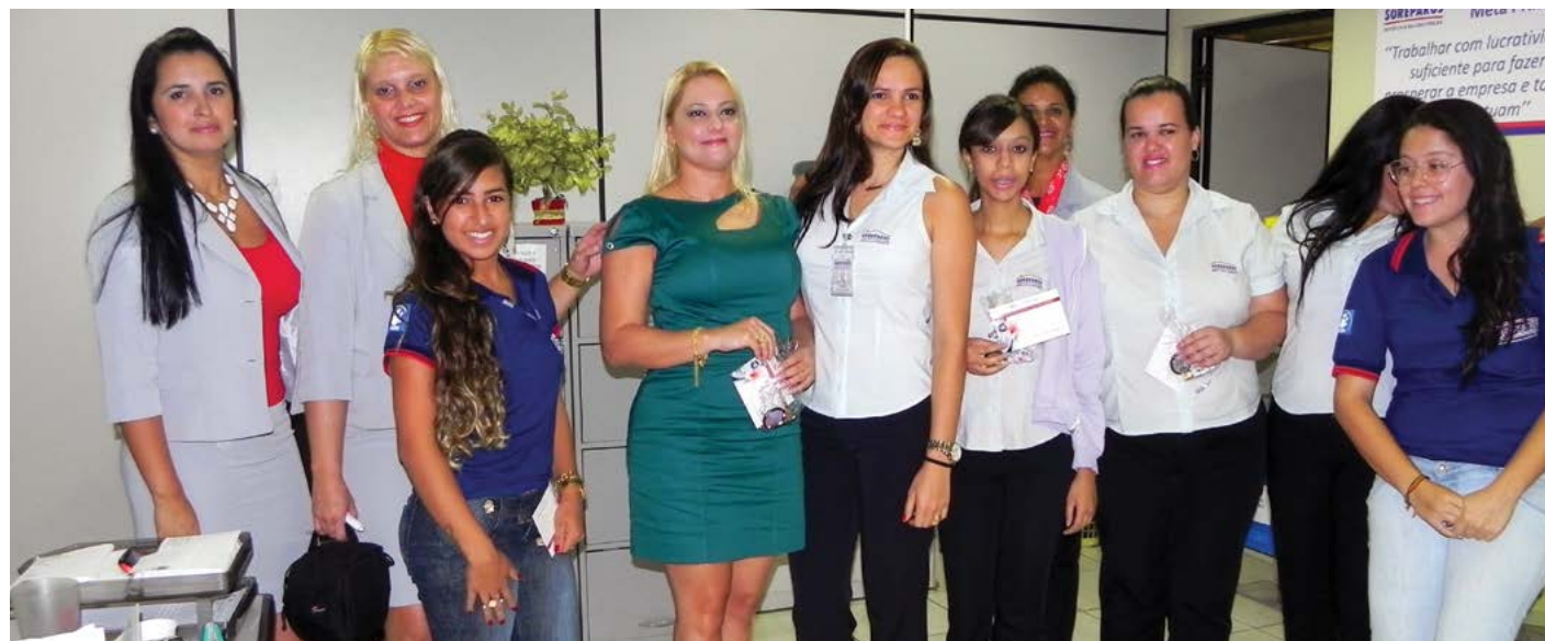
Presidente Luciana de Moraes visitou empresas para lembrar a importância da mulher no mercado de trabalho e a necessidade de se implementar políticas ainda mais progressistas em relação ao assunto

Sindicato visita empresas e propõe debate sobre participação feminina no mercado